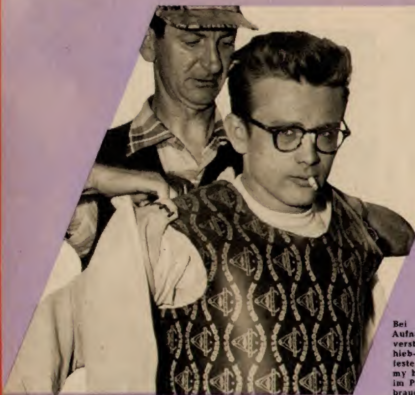
Bei gefährlichen Aufnahmen selbstverständlich: Eine hieb- und stichfeste Weste. Jimmy hätte sie auch im Privatleben gebrauchen können.

Jimmy lebt nur noch seiner Arbeit. Nichts anderes interessiert ihn mehr. Und niemand anderer interessiert sich für ihn — glaubt er. Eines Tages legt sich ihm in der Kantine eine leichte Hand auf die Schulter. Er schaut auf und blickt in zwei Märchenaugen. Die Augen Pier Angelis. Bald sind sie heimlich verlobt. Der übergelückliche Jimmy kommt zu Piers Mutter, um sie um die Hand ihrer Tochter zu bitten.